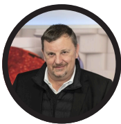
Modérateur de la table ronde Petz Bartz - RTL