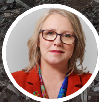
Sen. Alice-Mary Higgins

Alliance pour la Justice entre Israéliens et Palestiniens